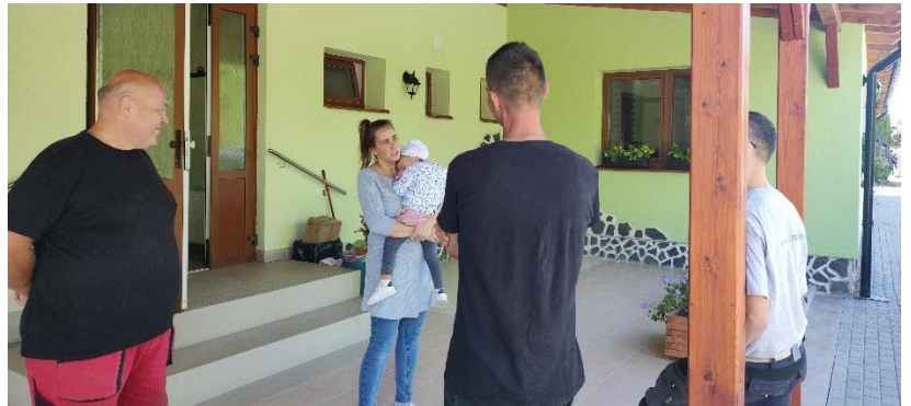
Foto: 6.10.2023 Kráľová pri Senci komunita Čenakolo. Odovzdali nám materiál na výrobu ružencov a veľa iných vecí.