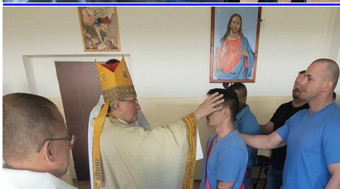
Foto: návšteva v ÚVTOS Banská Bystrica-Kráľová, kde dvaja naši členovia prijali sviatosť krstu a následne aj sviatosť birmovania, pričom k tejto sviatosti pristúpili ďalší dvaja odsúdení, jednému som išiel za birmovného otca, samozrejme, obaja sú naši členovia. Je to krásne ovocie krácania s Ježišom Kristom. Časť listu od bračeka z väznice v Ružomberku, ktorého najbližší zradili, podviedli, oklamali a opustili: „Modlil som sa, prosil Pána o silu, pomoc, aby zahnal tú ukrutnú bolesť, tak som šiel sa rozprávať s p. farárom. Kecalí