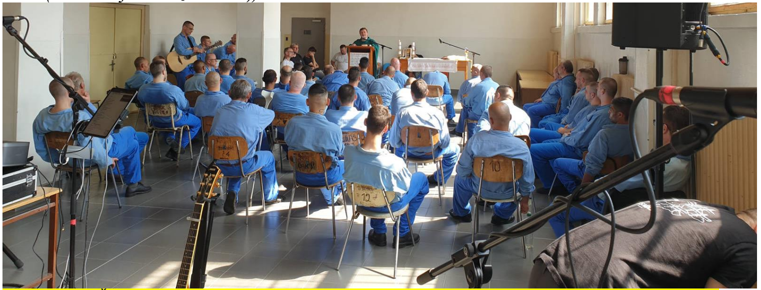
Foto: väznica Želiezovce počas sv. omše, kde nám zahrali aj členovia spoločenstva teda doprevádzali liturgiu.

PBJK (Pochválený buď Ježiš Kristus), drahá sestra v Kristovi.