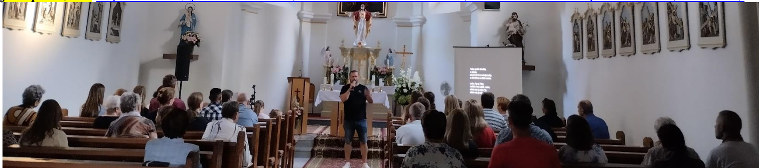
Foto: V nedeľu 17.9.2023 sme večer merali väčšiu vzdialenosť na juh Slovenska, kde sa nachádza dedinka