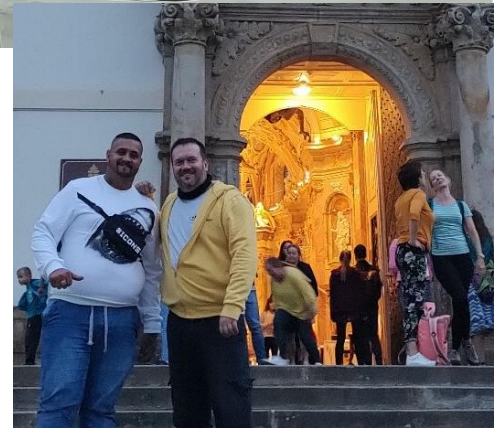
Foto: 23.9.2023 o 9:00 ráno sme docestovali do väznice Kuřim v Českej republike, kde bola neskutočne krásna evanjelizácia.