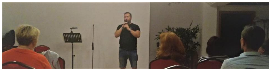
Foto: Pondelok 18.9.2023 v hoteli Spektrum v Trnave na stretnutí spoločenstva Kánán, kde sme hovorili o službe a milosrdenstve voči tým, čo sa ho boja. (porovnaj Lk 1,50) Ž 25,14 * Ž 33,18 * Ž 85,10 * Ž 103,11 * Ž 103,13 * Ž 103,17 * Ž 111,5 * Ž 147,11 * Zjv 19,5.

90% členov z Dismasu majú často podobné životné podmienky a z väznice sa nedá mnoho z toho robiť, ale dôležité je vytrvať a spoliehať sa na Pána a nie na človeka. A veľa z radov odsúdených sa spolieha na seba, seba majú za spasiteľa,