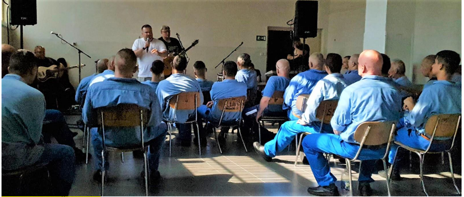
Foto: väznica Želiezovce už počas programu - modlitby chvál a svedectiev na oslavu Ježiša.

Foto: väznica Želiezovce počas sv. omše, kde nám zahrali aj členovia spoločenstva teda doprevádzali liturgiu.