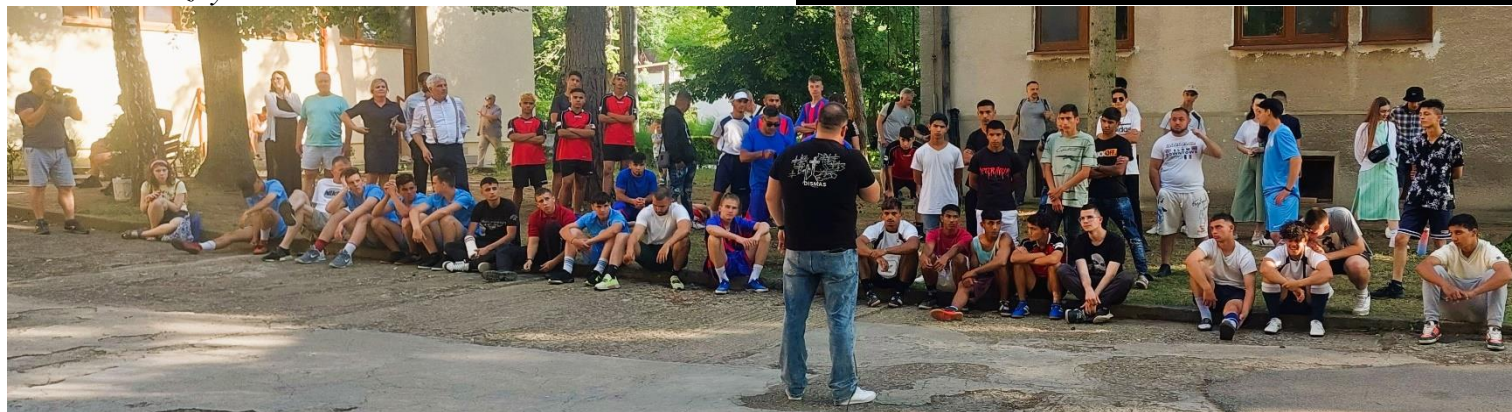
Foto: 27.5.2024 v reedukačnom centre (v polepšovni) v Hlohovci sa poobede stretli chlapci z celého Slovenska na