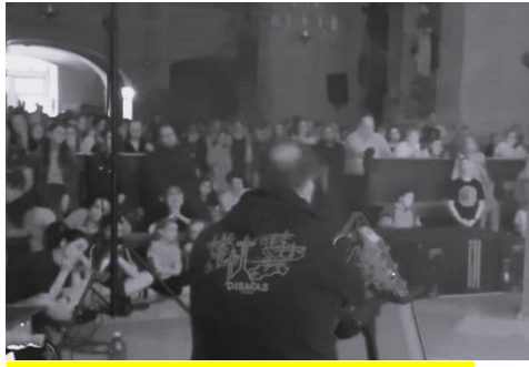
Foto: LUMEN Trnava 7.6.2024 pred polnocou počas svedectva a adorácie v kostole sv. Jakuba.

domov za svojimi priateľmi, za svojou láskou (chlapom). Myslel som si, že budem s ním žiť. O pár mesiacov na to mi zvonil telefón, po anglicky mi hovorí, sestra má nádor na mozgu, ktorý jej praskol, zober rodičov a príď sa s ňou rozlúčiť. Lebo nevedia doktori, čo s ňou bude. Ja som v tej chvíli nevedel, čo mám robiť. Modlil som sa. Ja budem radšej sám, ale zachráň mi sestru. Sestra nakoniec prežila a ja som sa ako 21 ročný rozišiel a odišiel z tohto vzťahu a začal som žiť sviatostne (svätá spoveď a Eucharistia - sviatosť prijímania). Vrátil som sa ku koreňom, kedy som ministroval. Nebola to ľahká cesta. Teraz mám tri krásne deti a štvrté na ceste. A som šťastný človek s mojou drahou manželkou. Uverte! Urobte to rozhodnutie zmeniť svoje zmýšľanie. Dnes sa modlím za vás.“