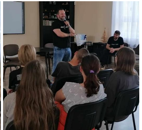
Foto: po väzbe v Košiciach sme išli v piatok 24.5.2024 do diagnostického centra v Košiciach.