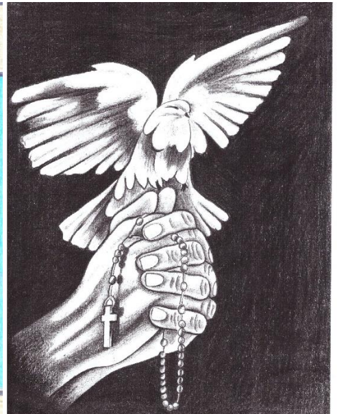
Tomáš z väznice Kuřim