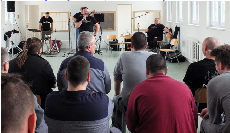
Foto: po obede sme sa zo ženskej väznice v Opave presunuli do väznice teda detencie tiež v Opave v Českej republike.