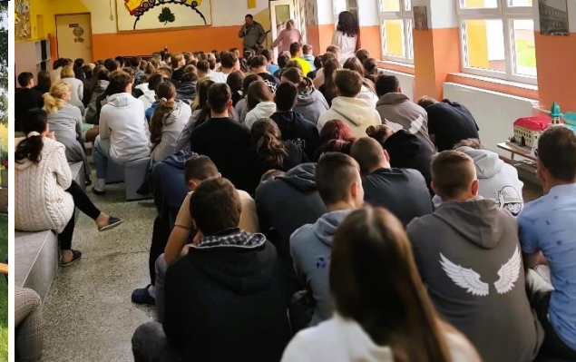
Velké Kostořany 9.6.2024 , balónový ruženec, modlitby a slová povzbudenia