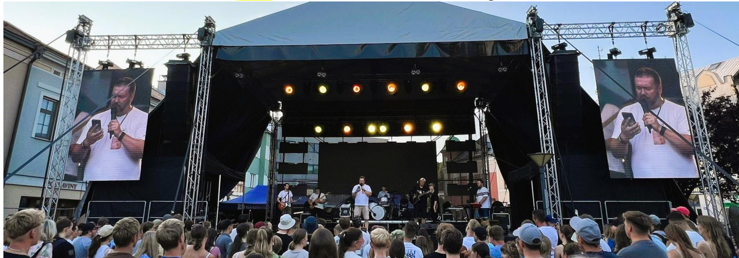
Foto: festival UNITED, Vsetín, dňa 24.8.2024, Česká republika.

Foto: dňa 24.8.2024 Rádio 7, Česká republika.