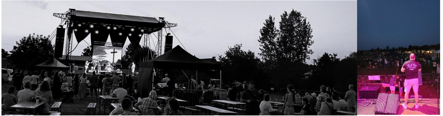
Foto: Nedeľa 25.8.2024 festival v Cabaj-Čápore. Boli tu ja viacerí členovia. Chvála Pánovi.