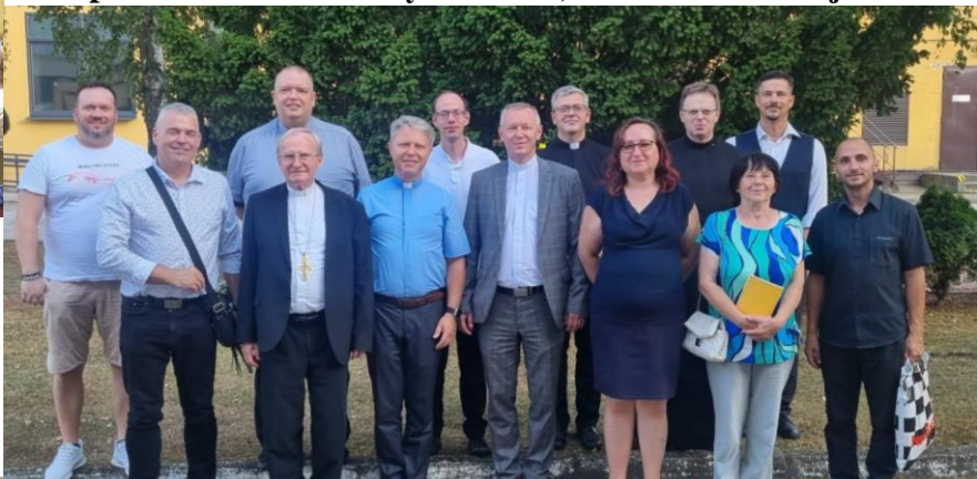
Foto: 18.8. Púť na zámok v Hlohovci. Túto púť prvýkrát zachytili pisatelia už v 18. storočí počas panovania rodu Erdődyovcov. Či už ide o púť alebo procesiu, tak chcem povedať, že sa ich zúčastňujú viacerí členovia nášho spoločenstva a tiež modlitebníci. Lebo my sme tu na tejto zemi len pútnici. Pútnici vo vyhnanstve, lebo naša vlasť je v nebi.

Zdroj: https://www.ordinariat.sk/oslava-patrocinia-sv-maximiliana-kolbeho-v-hrnčiarovciach/