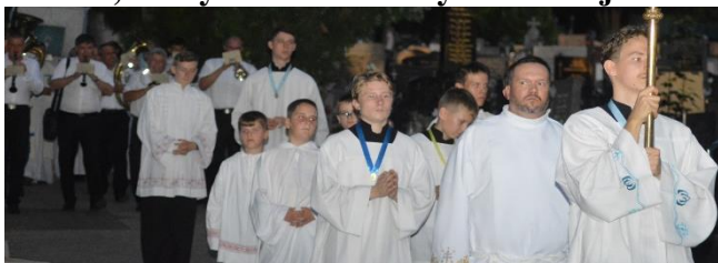
Foto: Procesia z cintorína do kostola cez mesto Hlohovec (vo večerných hodinách) zo dňa 15.8.2024,

Foto: 13.8.2024 sme boli pozvaní do online modlitieb s Dohovorom za rodinu, ktorý má z katolíckych médií jedno z najväčších čísel ohľadne sledovanosti.