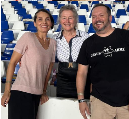
Foto: 4.9.2024 sme sa stretli s rodinkou u Ega, kde som mu dal podpísať karty.